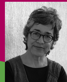
© Cristina Rivera Garza. By Theimadatter. CC BY-SA 4.0. Wikimedia Commons

Programa cultural: Lectura de Cristina Rivera Garza