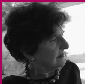
© Margo Glantz. By Alina López Cámara. CC BY-SA 3.0. Wikimedia Commons

Programa cultural: Lectura de Margo Glantz