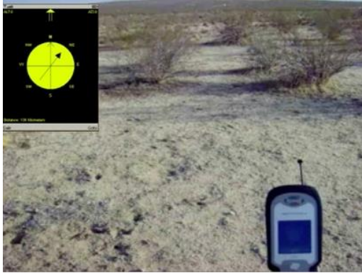
Imagen 1 y 2:

Electronic Disturbance Theater 2.0/b.a.n.g. lab (2007): Transborder Immigrant Tool (in situ). Electronic Disturbance Theater 2.0/b.a.n.g. lab (2007): Transborder Immigrant Tool (expuesto en 319 Scholes ).