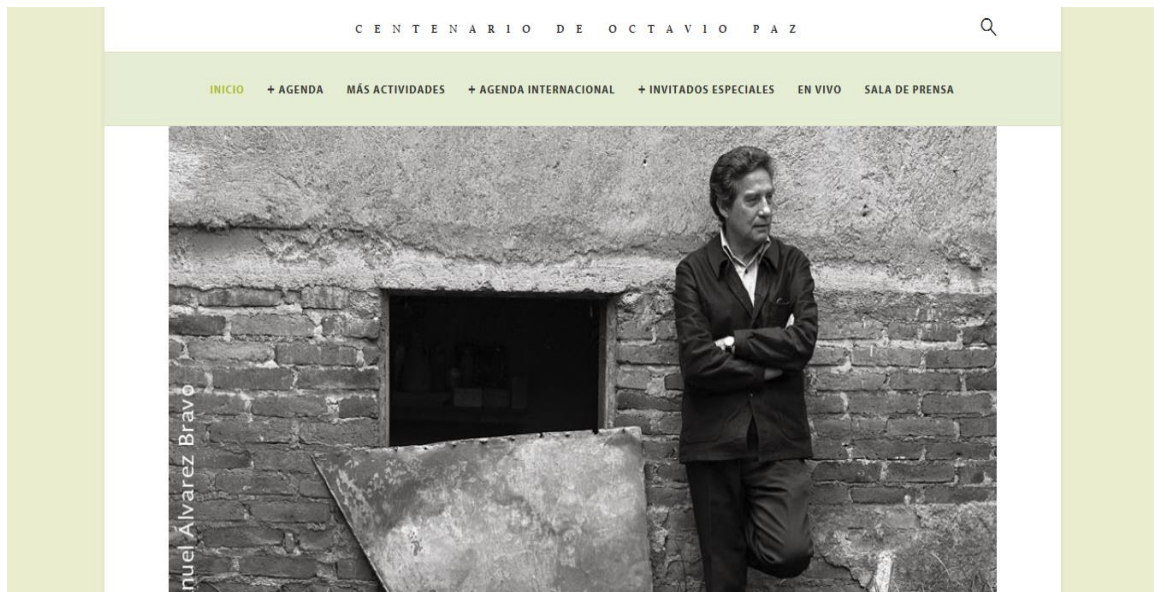
Imagen 2: Página oficial del Centenario de Octavio Paz (SEP / CONACULTA 2014b)

Además, en la misma página, se incluye una fotografía de Paz a la manera del 'Pensador' de Auguste Rodin, con el gesto supuestamente característico de los intelectuales: