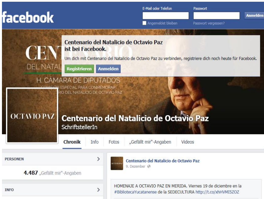
Imagen 5: Página web "Centenario del Natalicio de Octavio Paz" en Facebook (2014b)

La relativamente poca presencia y sobre todo la poca recepción en Facebook muestra que Paz puede ser un gran poeta y célebre intelectual, pero que al parecer no es el poeta de la generación Facebook. Quizá al menos la Secretaría de Educación Pública se dio cuenta de eso y regaló una antología de la obra de Paz a todos los alumnos del último grado de la secundaria del país, con un tiraje de 1.700.000 ejemplares. 10