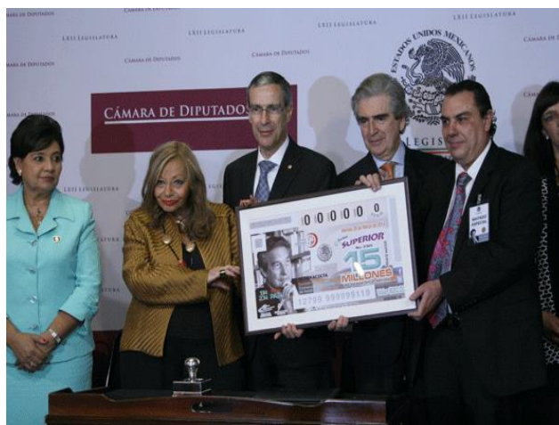
Imagen 7: Billete de la Lotería Nacional en Salmerón (2014)

Se añaden las actividades del Fondo de Cultura Económica, y el encuentro intelectual 'Octavio Paz y el mundo del siglo XXI' con ponencias de intelectuales de renombre, organizado por El Colegio Nacional, entre otros eventos como recitales y conciertos, todos ellos llevados a cabo en la capital mexicana. Aunque exista un enlace con actividades internacionales, ese se reduce a dos exposiciones y unas conferencias en Nueva York, Madrid y Varsovia. 14 Ese calendario nunca se actualiza en el curso de 2014, así que la gran mayoría de las actividades internacionales se excluye del programa oficial. En otras palabras: Octavio Paz se construye como intelectual universal, pero desde una mirada oficial estatal y desde una perspectiva centralista en la cual la capital cumple la función de centro absoluto del poder y de la vida cultural. Y aunque se destaque el universalismo de su obra sobre todo poética, lo que se festeja es el escritor en el ámbito nacional.