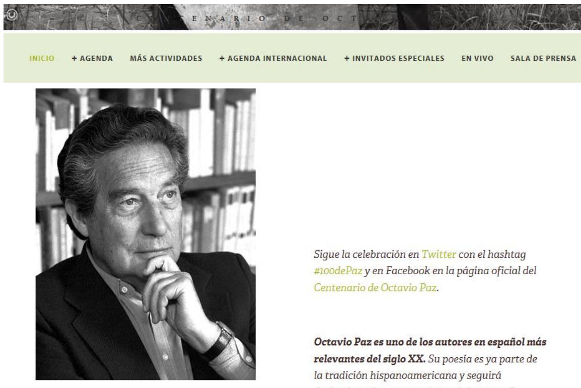
Imagen 3: Página oficial del Centenario de Octavio Paz (SEP / CONACULTA 2014b)

Además, en la misma página, se incluye una fotografía de Paz a la manera del 'Pensador' de Auguste Rodin, con el gesto supuestamente característico de los intelectuales: