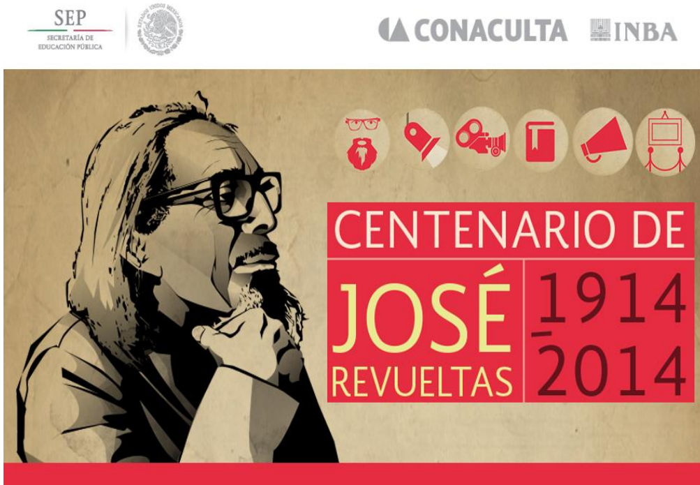
Imagen 13: Página web oficial del Centenario de José Revueltas (Secretaría de Cultura de la Ciudad de México 2014a) 22

El diseño parece menos cuidadoso que el de la página web oficial del Centenario de Paz, se mencionan mucho menos actividades que en el caso de ese último, y no hay una presencia de invitados internacionales ni existe una integración de las redes sociales como Facebook o Twitter en esa página oficial del Centenario de Revueltas.