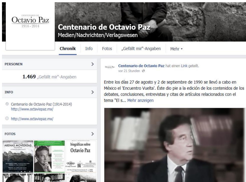
Imagen 4: Página web "Centenario de Octavio Paz" en Facebook (2014a).

Lo interesante es que otra página de Facebook, la de la Cámara de Diputados, tiene muchos más "Me gusta" clics que la que mencionaba antes. El día 13 de diciembre de 2014 han sido 4.487. 9 Hasta junio de 2015, esos "Me gusta" clics se han reducido a 4.371 sin que pudiéramos averiguar las razones concretas o percibir cuáles de los comentarios han sido borrados.