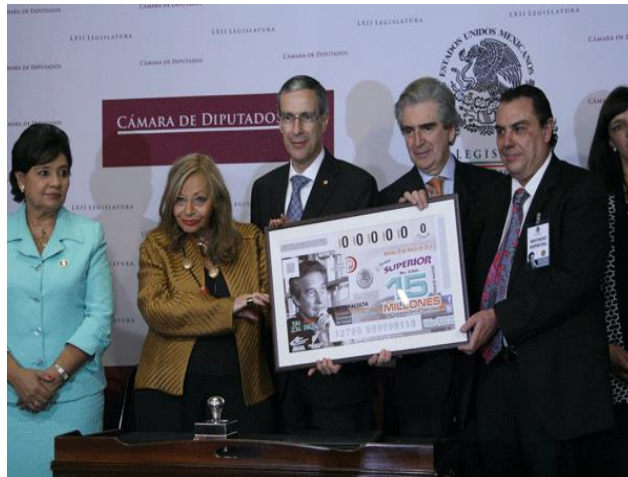
Imagen 7: Billete de la Lotería Nacional en Salmerón (2014)

Se añaden las actividades del Fondo de Cultura Económica, y el encuentro intelectual 'Octavio Paz y el mundo del siglo XXI' con ponencias de intelectuales de renombre, organizado por El Colegio Nacional, entre otros eventos como recitales y conciertos, todos ellos llevados a cabo en la capital mexicana. Aunque exista un enlace con actividades internacionales, ese se reduce a dos exposiciones y unas conferencias en Nueva York, Madrid y Varsovia. 14 Ese calendario nunca se actualiza en el curso de 2014, así que la gran mayoría de las actividades internacionales se excluye del programa oficial. En otras palabras: Octavio Paz se construye como intelectual universal, pero desde una mirada oficial estatal y desde una perspectiva centralista en la cual la capital cumple la función de centro absoluto del poder y de la vida cultural. Y aunque se destaque el universalismo de su obra sobre todo poética, lo que se festeja es el escritor en el ámbito nacional.