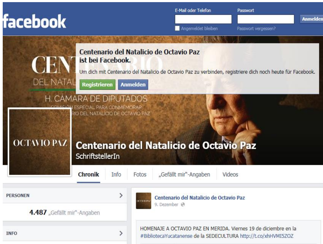
Imagen 5: Página web "Centenario del Natalicio de Octavio Paz" en Facebook (2014b)

La relativamente poca presencia y sobre todo la poca recepción en Facebook muestra que Paz puede ser un gran poeta y célebre intelectual, pero que al parecer no es el poeta de la generación Facebook. Quizá al menos la Secretaría de Educación Pública se dio cuenta de eso y regaló una antología de la obra de Paz a todos los alumnos del último grado de la secundaria del país, con un tiraje de 1.700.000 ejemplares. 10