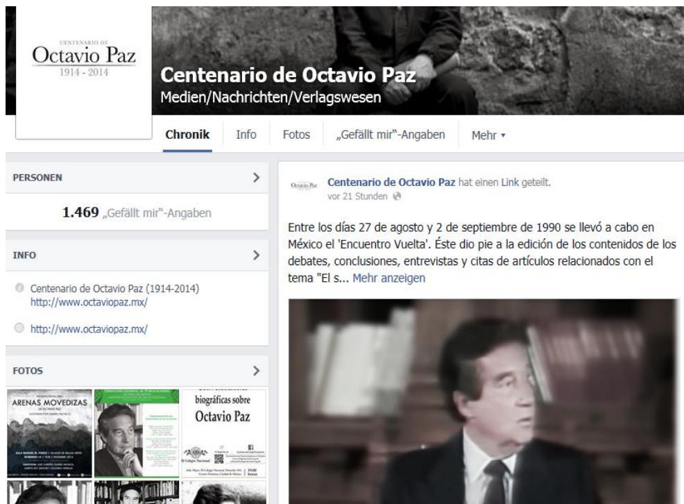
Imagen 4: Página web "Centenario de Octavio Paz" en Facebook (2014a).

Lo interesante es que otra página de Facebook, la de la Cámara de Diputados, tiene muchos más "Me gusta" clics que la que mencionaba antes. El día 13 de diciembre de 2014 han sido 4.487. 9 Hasta junio de 2015, esos "Me gusta" clics se han reducido a 4.371 sin que pudiéramos averiguar las razones concretas o percibir cuáles de los comentarios han sido borrados.