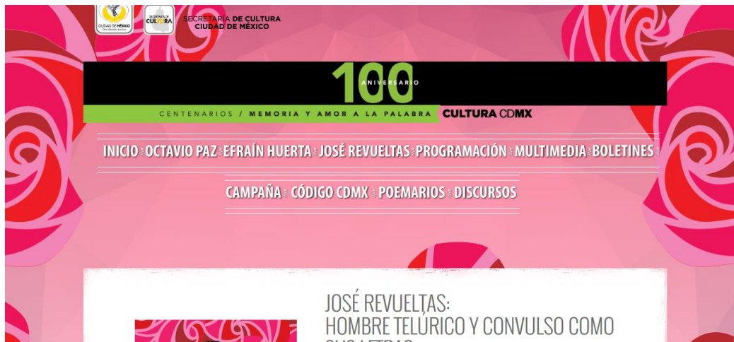
Ilustración núm. 14: Página web de la Secretaría de Cultura de la Ciudad de México (2014a)

Al menos en ese rincón del mundo virtual, los tres escritores aparecen en un mismo nivel. Lo mismo pasa cuando los nombres de los tres escritores se inscriben en letras de oro en el muro de honor de la Asamblea Legislativa del Distrito Federal. 23