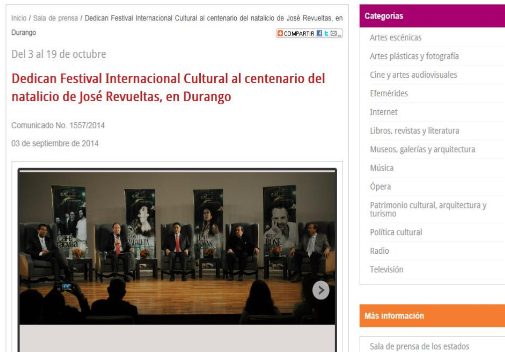
Imagen 12: Conferencia de prensa, apertura Festival Internacional Cultural en SEP / CONACULTA (2014c)

Además existe el "Premio Bellas Artes de Ensayo Literario José Revueltas"(este último organizado por CONACULTA), cuya edición de 2014 se dedica exclusivamente a trabajos sobre ese escritor, y se lanzan re-ediciones de sus obras literarias. En comparación con las conmemoraciones de Paz que en su mayoría se limitan al espacio del Distrito Federal, las de Revueltas se realizan en diversos estados de la República, pero se organizan en gran parte desde la provincia, desde la periferia de la vida cultural oficial del país, y muchas veces se incluyen en programas culturales ya existentes que ahora se dedican en parte o exclusivamente a la obra de Revueltas –no en menor grado por falta de recursos económicos.