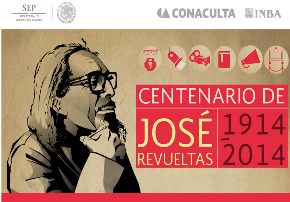
Imagen 13: Página web oficial del Centenario de José Revueltas (Secretaría de Cultura de la Ciudad de México 2014a) 22

El diseño parece menos cuidadoso que el de la página web oficial del Centenario de Paz, se mencionan mucho menos actividades que en el caso de ese último, y no hay una presencia de invitados internacionales ni existe una integración de las redes sociales como Facebook o Twitter en esa página oficial del Centenario de Revueltas.