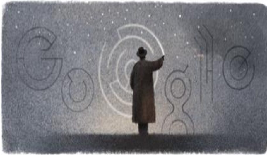
Imagen 11: doodle del 31 de marzo de 2014 en Google ("100.º aniversario del nacimiento de Octavio Paz (nacido en 1914)")

destacada de España donde se organizan exposiciones, lecturas, simposios y la presentación de un número especial de Cuadernos Hispanoamericanos . 18 Sobre todo el periódico El País mantiene presente la memoria de Paz en una serie de artículos. 19 Incluso la UNESCO se suma a las celebraciones. 20 Y por supuesto Google está presente –con un doodle el día del natalicio del Premio Nobel, doodle al cual se suman todos los países hispanohablantes menos Cuba y la Argentina. 21