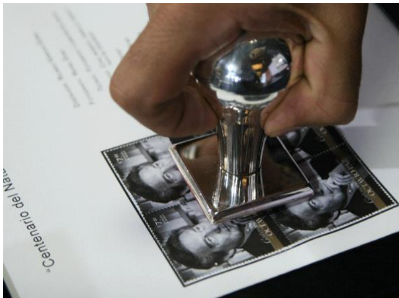
Imagen 6: Cancelación del timbre conmemorativo en Salmerón (2014)

Si la página inicial oficial festeja a Paz como escritor e intelectual de corte universalista, la agenda, en cambio, se reduce casi exclusivamente al espacio nacional, y hay una abundante presencia de instituciones estatales. 12 Se enumeran las actividades de la Cámara de Diputados (cancelación del timbre conmemorativo y emisión de un billete de la Lotería Nacional, entre otras) 13 , y del Senado de la República (lecturas, conferencias y la presentación de la página web oficial).