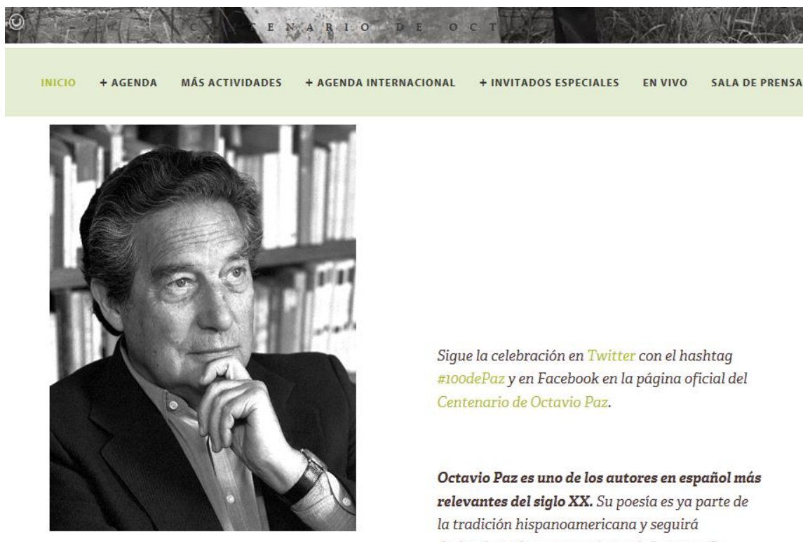
Imagen 3: Página oficial del Centenario de Octavio Paz (SEP / CONACULTA 2014b)

Además, en la misma página, se incluye una fotografía de Paz a la manera del 'Pensador' de Auguste Rodin, con el gesto supuestamente característico de los intelectuales: