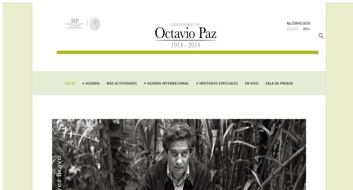
Imagen 1: Página oficial del Centenario de Octavio Paz (SEP / CONACULTA 2014b) 4

Fíjense, por favor, en el diseño de la página inicial: destaca la falta de colores más allá de una línea verde debajo del título y de unos enlaces verdes que indican la presencia del Centenario en las redes sociales de Twitter y Facebook (regresaré a ese último punto más adelante). Este diseño se fortalece mediante dos fotografías de Manuel Álvarez Bravo, retratos de Octavio Paz tomados a finales de la década de 1970 5 , y otra foto no identificada (que podría ser de Bravo también) que soportan el enunciado de la página web. 6 Además, el hecho de que las fotografías escogidas para la página web muestran a un hombre maduro, casi se diría sin edad identificable, y sin mostrarlo en diferentes épocas, les quita a los retratos la dimensión del tiempo, dándonos la impresión de un Paz 'eterno', fuera del tiempo histórico.