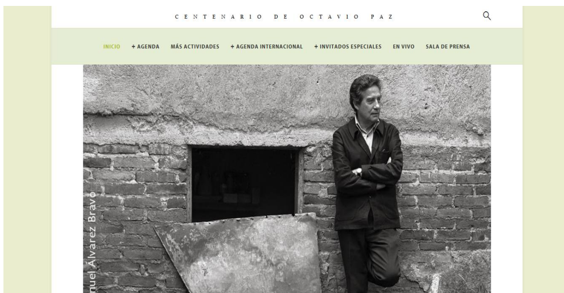
Imagen 2: Página oficial del Centenario de Octavio Paz (SEP / CONACULTA 2014b)

Además, en la misma página, se incluye una fotografía de Paz a la manera del 'Pensador' de Auguste Rodin, con el gesto supuestamente característico de los intelectuales: