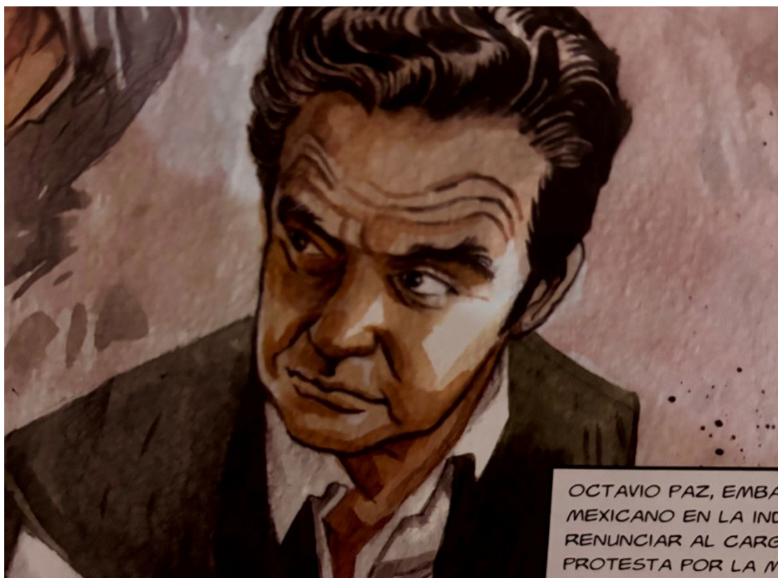
Fig. 7. Octavio Paz en El último tramo del siglo XX en México, 39.

Aparece igual la figura de Octavio Paz, escritor mexicano que en 1991 ganó el Premio Nobel de Literatura. Durante los eventos ocurridos en 1968, Paz se desempeñaba como embajador de México en la India. Sin embargo, tras enterarse vía la BBC de la represión ejercida por el gobierno mexicano, Paz renunció al cargo como una protesta ante las acciones tomadas por la administración federal. 56 Posteriormente publicó el poema "México 68", en el que denunció los actos cometidos en contra de los manifestantes. Sus protestas fueron bien recibidas por la