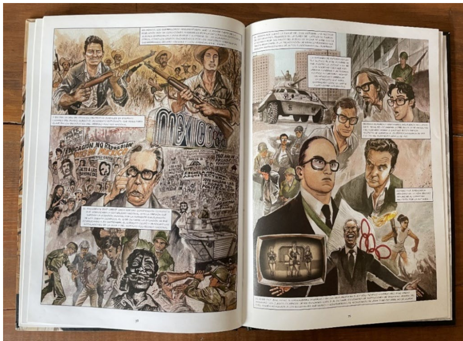
Fig. 1. El 68 mexicano en El último tramo del siglo XX en México , 38–39.

Debido a que esta obra presenta los hechos de manera cronológica, la aparición del 68 mexicano es breve, se limita a dos páginas; sin embargo, resulta una interpretación reciente sobre esta coyuntura acorde con los nuevos hallazgos al respecto. La composición de las imágenes fue efectuada en acuarela; José Luis Pescador se inspiró en la estética del muralismo, la fotografía periodística y la televisión para conformar un pastiche , un ensamblaje realizado a partir de fragmentos extraídos de diversas fuentes 27 que imitan a las corrientes artísticas y los medios antes mencionados, el cual resume los antecedentes, causas, desarrollo y consecuencias del Movimiento Estudiantil 28 para aproximarlos de una manera afable y sencilla al estudiantado.