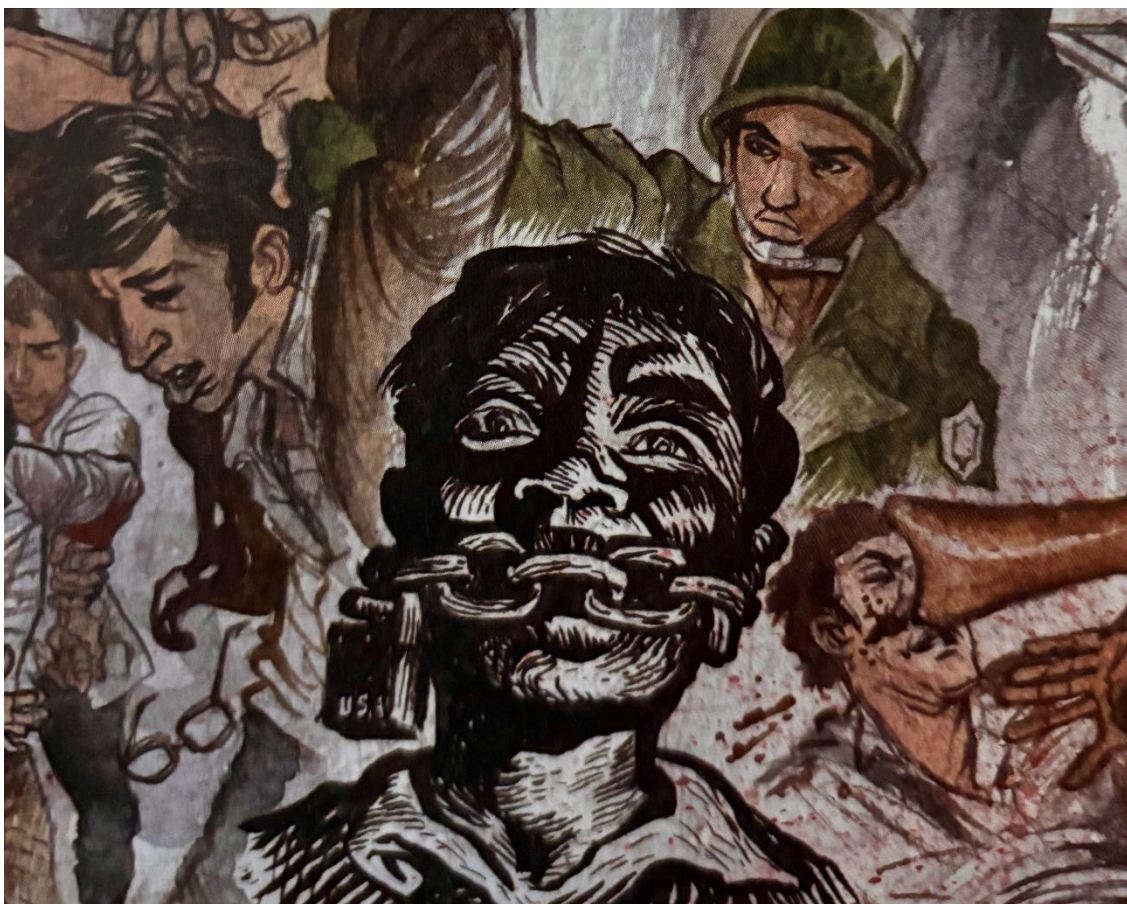
Fig. 5. Libertad de expresión , de Adolfo Mexiac en El último tramo del siglo XX en México , 38.

Ubicado en la primera página, en el centro de la parte inferior, se localiza el grabado Libertad de expresión , creado en 1954 por Adolfo Mexiac, uno de los últimos representantes del Taller de Gráfica Popular (TGP), conjunto de artistas que operó desde finales de los años 30 y que se caracterizó por un trabajo colectivo, la preferencia del grabado y la litografía como medios de expresión y difusión, la reproducción de sus obras y la generación de un arte social comprometido con la educación del pueblo. 47 La obra muestra a un joven tzotzil amordazado por una cadena, lo cual simboliza que en los gobiernos aparentemente democráticos no se respetan dos de sus principios fundamentales: la democracia y la libertad de expresión. 48