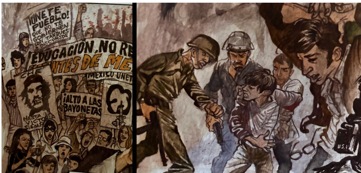
Fig. 9. La prensa y otros medios en El último tramo del siglo XX en México , 38.

Las ilustraciones de las manifestaciones estudiantiles, así como de la violencia acometida en su contra, se asemejan a las fotografías publicadas por periódicos, revistas y suplementos como Excélsior , La Prensa , Tiempo , Life en español , ¿Por qué? , Sucesos , Siempre! y La cultura en México . Su aparición exhibe los distintos ángulos con los que se brindó cobertura al movimiento y la manera en que los medios de comunicación construyeron un imaginario colectivo que influyó en los distintos sectores de la población y que continúa transmitiéndose hasta ahora. 61 Igualmente, estas imágenes dentro del pastiche resultan la visión de los historiadores que laboraron en el Colegio de México sobre el Movimiento Estudiantil, las que contradicen la versión gubernamental de la conjura.