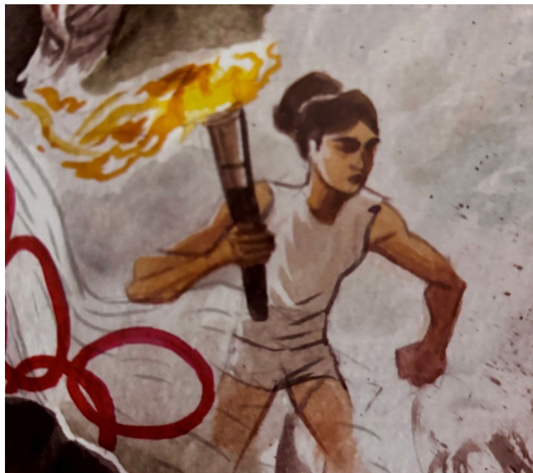
Fig. 8. Enriqueta Basilio en El último tramo del siglo XX en México , 39.

Enriqueta Basilio fue una velocista mexicana que compitió en los Juegos Olímpicos de 1968 en las pruebas de 800 metros, 400 metros con vallas y relevos 4 por 400 metros. Fue la primera