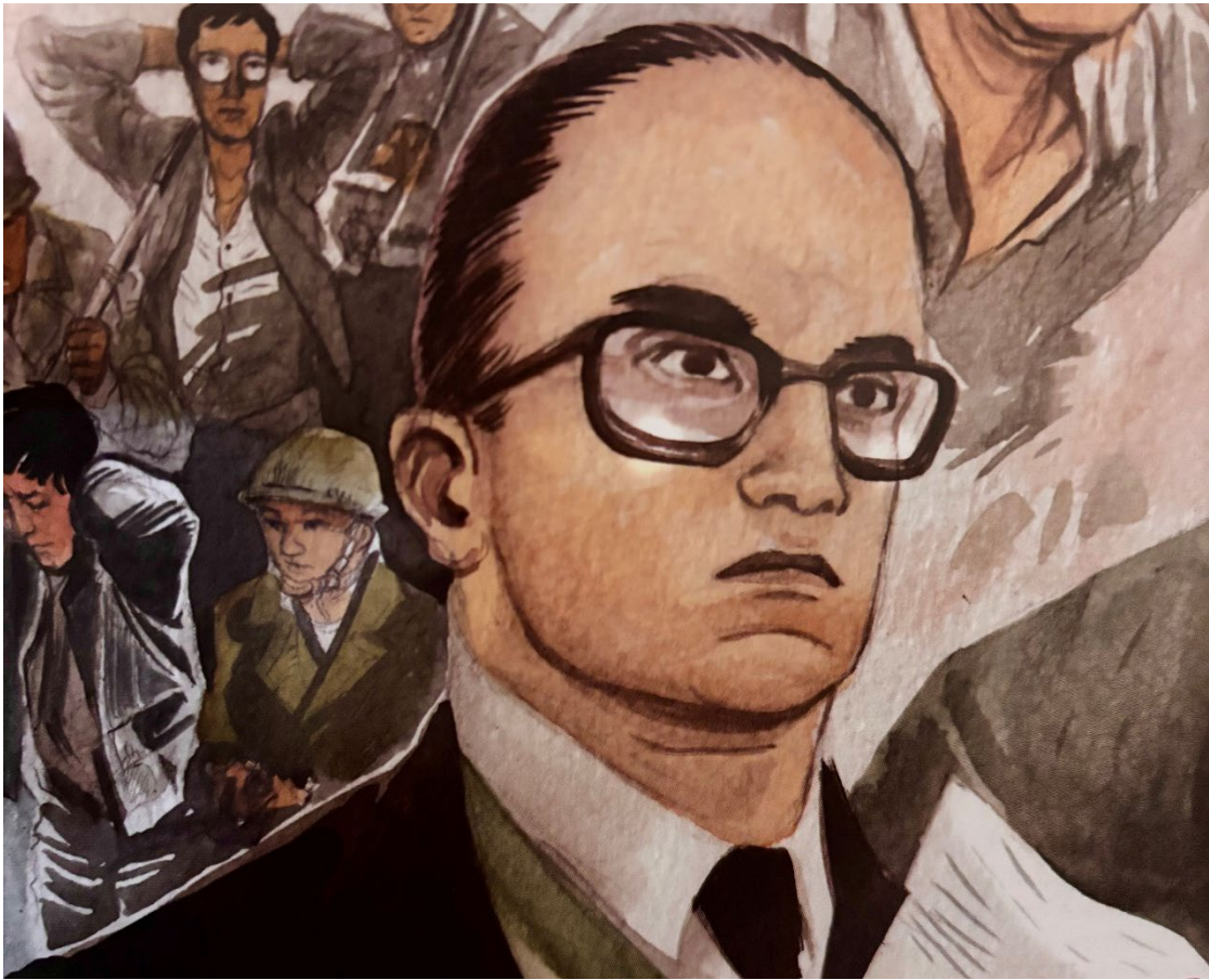
Fig. 3. Luis Echeverría Álvarez en El último tramo del siglo XX en México , 39.

Tenemos también a Luis Echeverría Álvarez, quien fue secretario de Gobernación durante el sexenio de Díaz Ordaz y posterior presidente de la república de 1970 a 1976. También fue señalado como uno de los responsables de la represión estudiantil durante 1968, así como el 10 de junio de 1971 en la Ciudad de México, suceso popularmente conocido como "el Halconazo". 37 Durante su gestión presidencial, trató de reestablecer una buena imagen del gobierno por medio de amnistías, la creación de nuevas universidades como la Autónoma Metropolitana (UAM) y apoyos para la clase trabajadora. Los resultados fueron moderados, 38 al tiempo que manifestaciones culturales como el rock fueron prohibidas y marginadas a sitios como los hoyos fonquis. 39